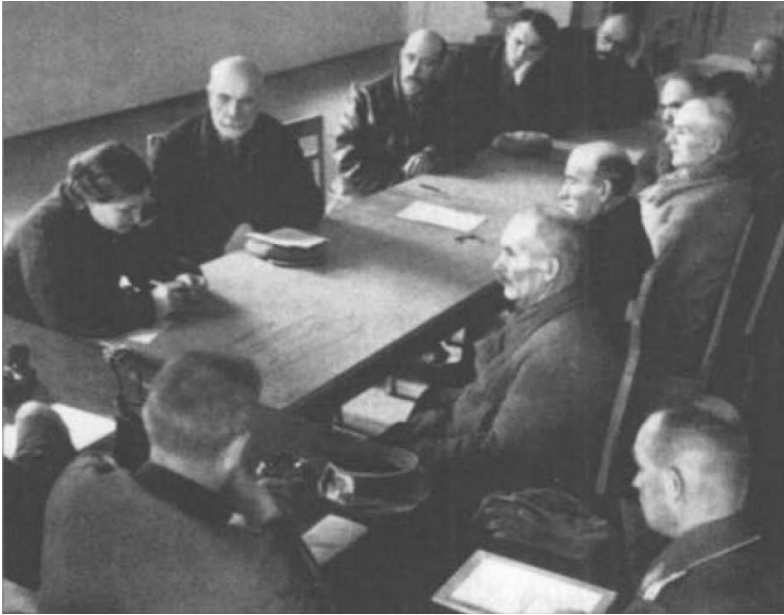
Ein deutscher Kreislandwirt bespricht in den besetzten Ostgebieten mit einheimischen Bauern Maßnahmen zu einer Reform der Landwirtschaft

Munition, die explodierte und die Insassen tötete. Das sind traurige Taten, aber es war nicht die deutsche Politik, die sie verursacht hat. Wir mussten uns mit illegalen Handlungen auseinandersetzen und darauf reagieren; unsere Reaktionen entsprachen den Regeln des Krieges. Wie ich bereits sagte, kann man nicht eine ganze Armee aufgrund der isolierten Aktion einer kleinen Gruppe von Kriminellen verurteilen, die außerhalb der Befehle handeln. Wenn diese Männer erwischt wurden, sei es in der SS