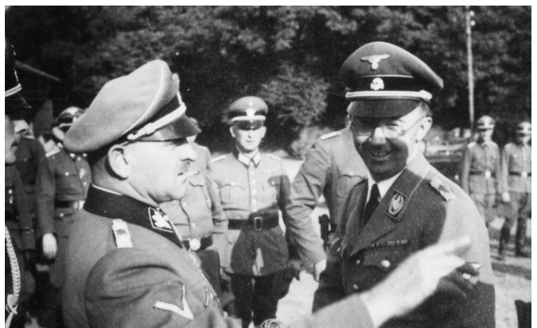
Frankreich, Metz, September 1940: Heinrich Himmler mit Offizieren der LAH, Himmler in Gespräch mit Sepp Dietrich

Heinrich: Es wird viel über sie geschrieben, und ich werde immer wieder gebeten, Fragen zu den beiden zu beantworten. Ich werde vielleicht ein Buch schreiben, wenn ich nicht vorher etwas vergesse. Ich kam bei Kriegsende in den Stab des RF [Reichsführer] und er war nicht mehr derselbe Mann, den ich von früher kannte, der Krieg hatte ihn deprimiert und beunruhigt. Die meisten von uns befanden sich jedoch in diesem Zustand, da alles, wofür wir gekämpft hatten, verloren war. Sepp war ein Soldat und er war beliebt und respektiert. Er war der beliebtere von beiden, denn die Waffen-SS bestand aus