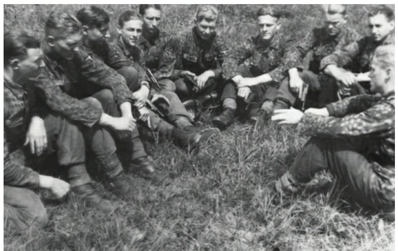
SS-Rekruten bei einer Übung

Heinrich: Hmm, das ist eine schwierige Frage. Ich würde sagen, ich musste meine Männer bei der Stange und im Kampf halten, während an der Heimatfront so viel los war. Viele unserer Männer hatten Familie, Freunde oder Verwandte, die von den Bombenangriffen betroffen waren. Wir mussten verfügbar sein und Priester zur Verfügung stellen, wenn sie einen brauchten. Neue Rekruten hatten es am schwersten, denn sie mussten eingearbeitet werden. Ein neuer Soldat brauchte einige Wochen, um sich einzugewöhnen. Sie konnten anfangs ganz schön anstrengend sein. 1940 hatte die frühe 38/40 Maschinenpistole die