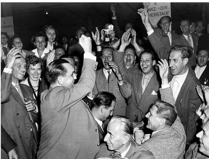
HIAG Treffen Karlburg 1957

vom Krieg und viele wollen einfach vergessen, wie der Krieg war. Wir haben viele Jahre in der Angst vor einem neuen Krieg gelebt, und jetzt können wir aufatmen. Dies sind alte Relikte, die nur für einige wenige alte Kämpfer, die noch da sind, von Bedeutung sind. Was wird aus ihnen für die zukünftigen Generationen, denen man beibringt, uns und alles, wofür wir gekämpft haben, zu hassen. Es ist schon schwer genug, Wiedersehenstreffen zu veranstalten, ich habe Angst vor dem, was die Zukunft für uns bereithält. Mein Glaube und meine Zugehörigkeit verbinden mich mit meinen Kameraden, von denen ich weiß, dass sie sehr tapfere Männer sind und ausgezeichnete Soldaten waren.