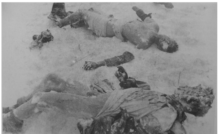
Durch Partisanen in der Nähe von Moskau 1941 verstümmelte deutsche Soldaten. Es ist verständlich, daß der Anblick solcher Greuelthaten zu immer härteren Vergeltungsmaßnahmen bewog.