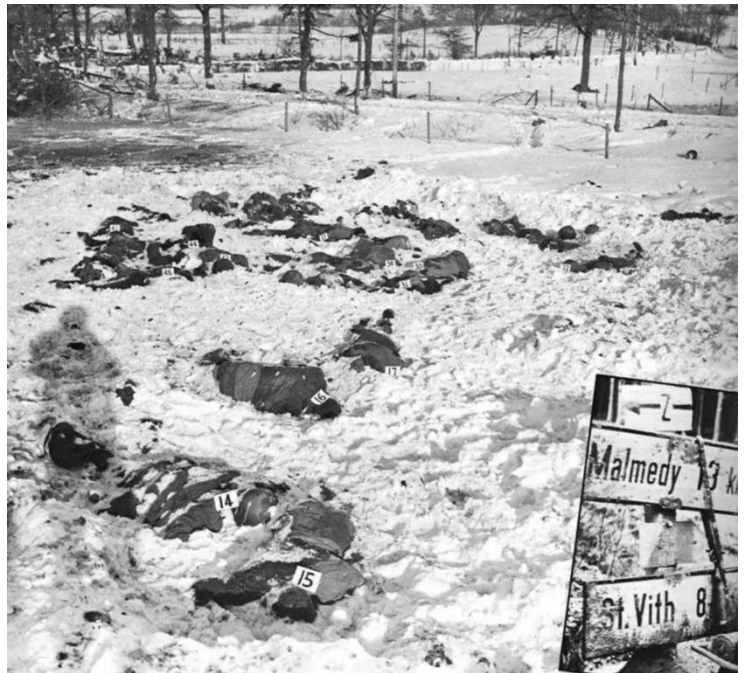
Aufnahme der verschneiten und gefrorenen Leichen der US-Soldaten

Dies führte dazu, dass einige Amerikaner, die Befehle befolgten, von neu alarmierten Soldaten angegriffen wurden, die auf alles schossen, was eine andere Uniform trug. Es tut mir leid, aber dies ist kein vorsätzliches Verbrechen, wie behauptet wird. Das ist nur dann ein Verbrechen, wenn unsere Männer sie ins Feld schicken und dann den Befehl geben, alle Gefangenen zu töten. Das war nicht unser