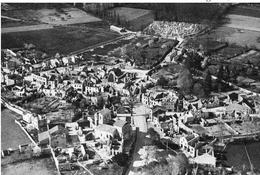
Oradour-Sur-Glane, Juni 1944

Dies führte dazu, dass einige Amerikaner, die Befehle befolgten, von neu alarmierten Soldaten angegriffen wurden, die auf alles schossen, was eine andere Uniform trug. Es tut mir leid, aber dies ist kein vorsätzliches Verbrechen, wie behauptet wird. Das ist nur dann ein Verbrechen, wenn unsere Männer sie ins Feld schicken und dann den Befehl geben, alle Gefangenen zu töten. Das war nicht unser